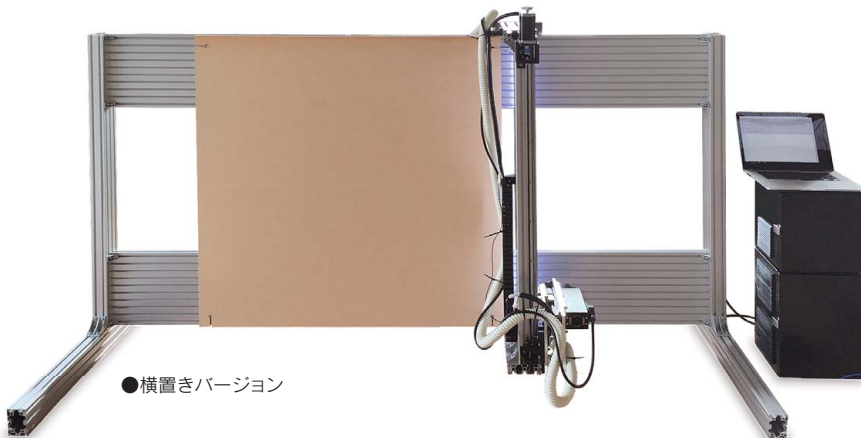
●横置きバージョン

FabLab、工務店、学校、アーティスト、 建築家、家具作家、木工作家、構造設計者、 ものづくりに関わる全ての人たちに！