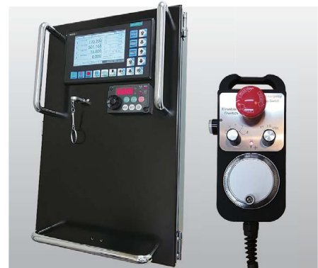
新型メインコントローラ & 手動パルスコントローラ USBメモリで加工データを取り込みます。