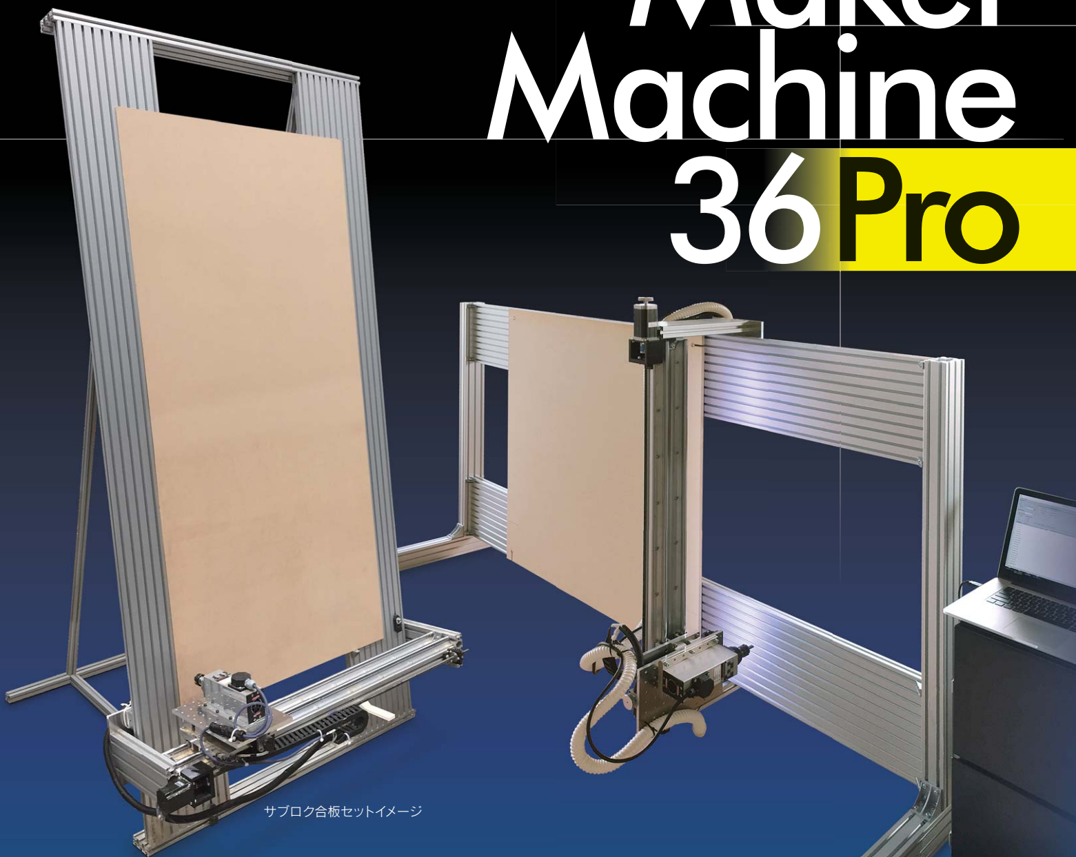
サブロク合板セットイメージ